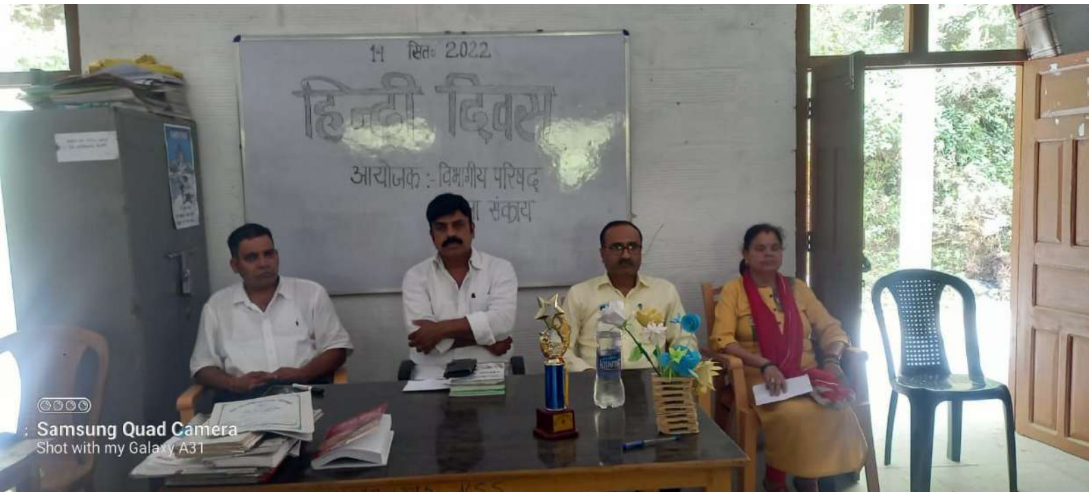
Samsung Quad Camera Shot with my Galaxy A31